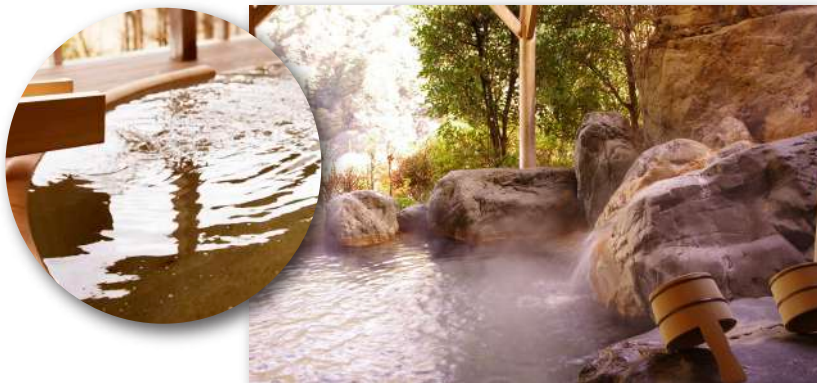
おおたき龍神湖を眺める露天風呂