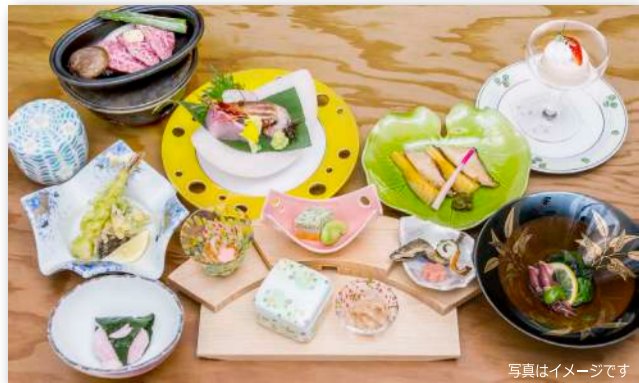
ご夕食は湯盛会席をご用意させていただきます